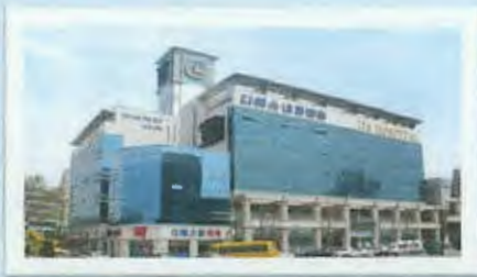
DS 내과병원 전경

1965 대성의원 개원 1979 대성병원 개원 1980 재단법인 대성재단 설립 1980 서울대성병원 설립 1984 부천대성병원 설립 1986 일본 애전재단 자매결연 및 학술연구