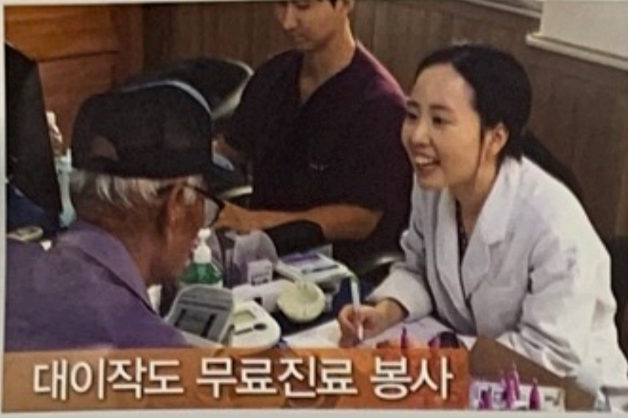
대이작도 무료진료 봉사

지역사회의 보건향상을 위한 다양한 건강강좌, 무의촌 무료진료를 비롯한 여러 봉사활동을 통해 존경받는 의료기관, 가치를 높이는 의료기관:현대유비스병원