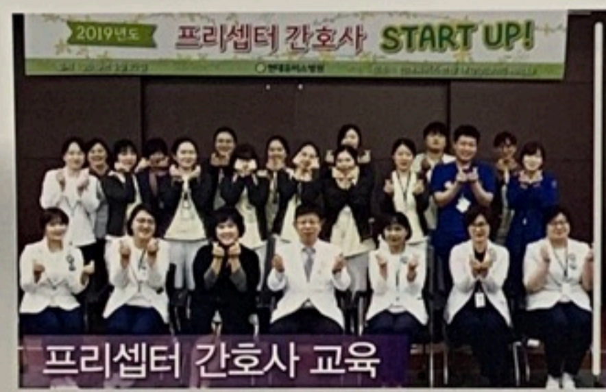
프리셉터 간호사 교육

신규간호사 워크샵, 1주년 근속기념 해외연수, 다양한 교육프로그램으로 성장과 발전을 약속하는 병원:현대유비스병원