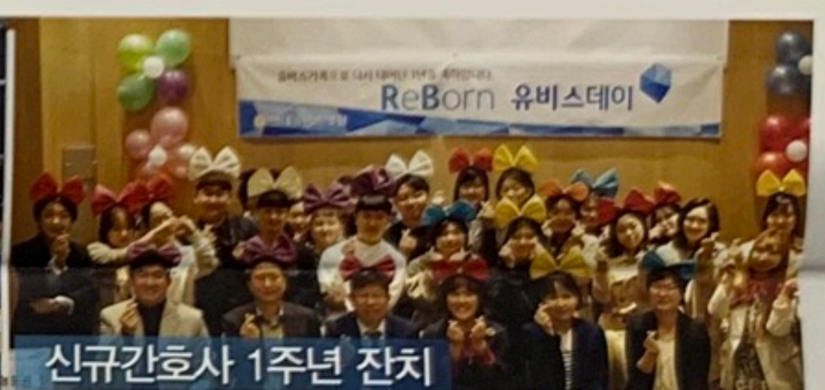
신규간호사 1주년 잔치