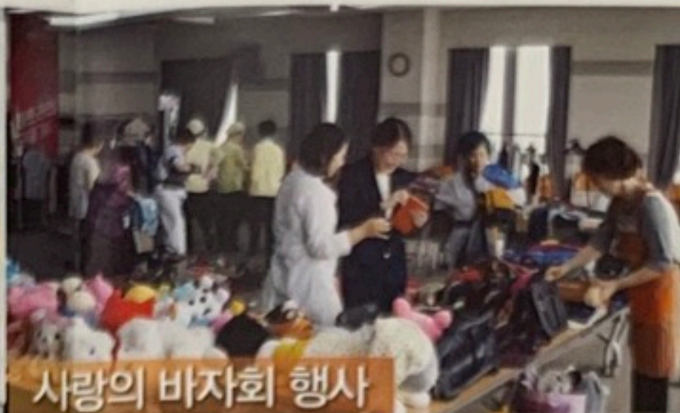
사랑의 바자회 행사