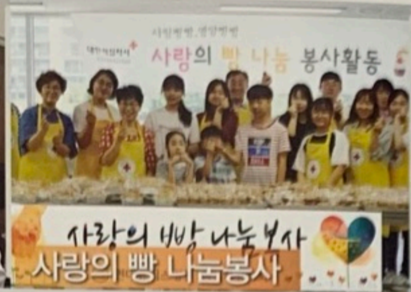
사랑의 빵 나눔봉사